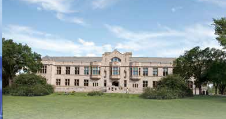
サスカチュワン大学キャンパス風景