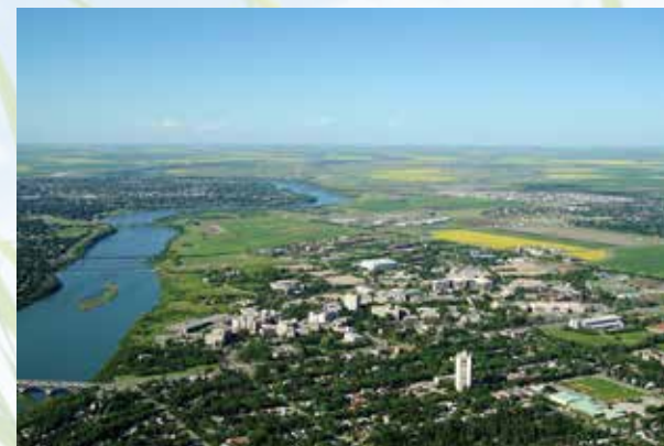
(University of Saskatchewan)